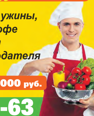
График работы 2/2 м. Рассказовка

Обеды, ужины, чай и кофе за счёт работодателя